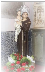
Foto: Igreja de S. Domingos